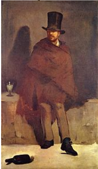
Manet: Der Absinthtrinker