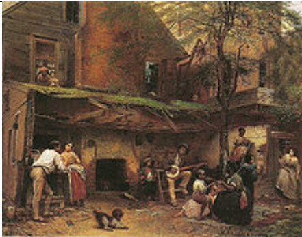
Negro Life at the South